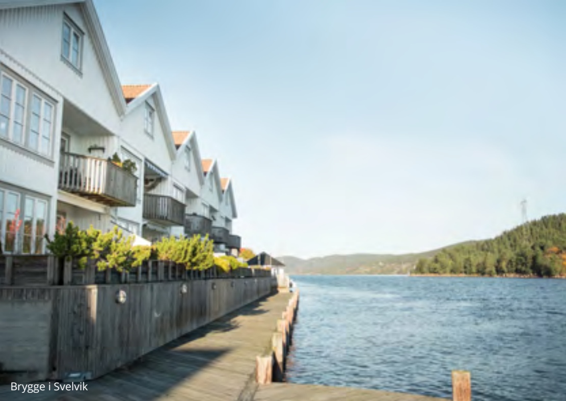
Brygge i Svelvik